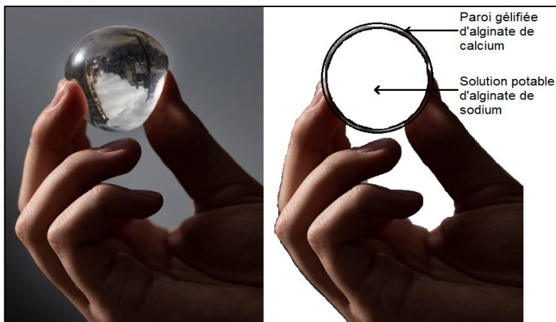
Reproductions à l'échelle 1/2